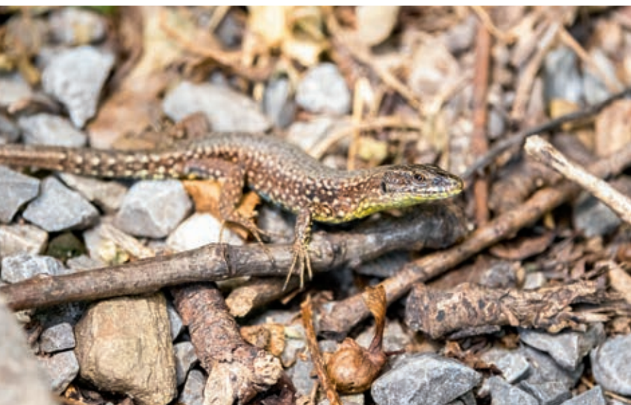
Unten: Im Frühjahr werden die Mauereidechsen aktiv und gehen auf Partnerwahl.